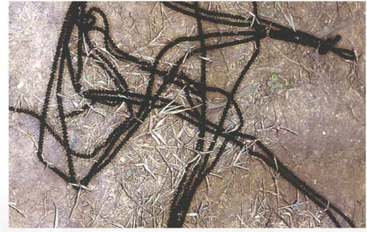
oeufs de crapaud calamite

Je suis beau, n'est ce pas? Remarquez ma magnifique ligne vertébrale jaune et mes superbes yeux jaunes vif réticulé de noir.