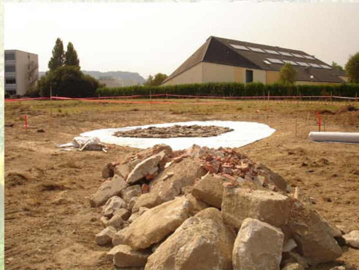
gîte et mare du crapaud calamite en construction

Un hôtel 3* ! Merci les copains! J'ai des goûts très simples: un peu d'eau qui chauffe au soleil pour mes pontes et têtards, des cailloux et pas trop de décoration: les plantes attirent les poissons et les autres amphibiens qui viennent dévorer mes petits!