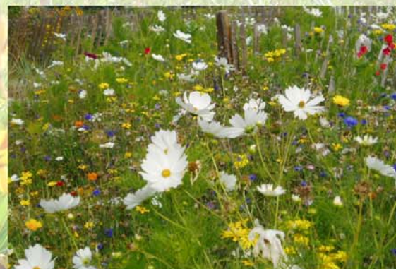
prairie fleurie semée