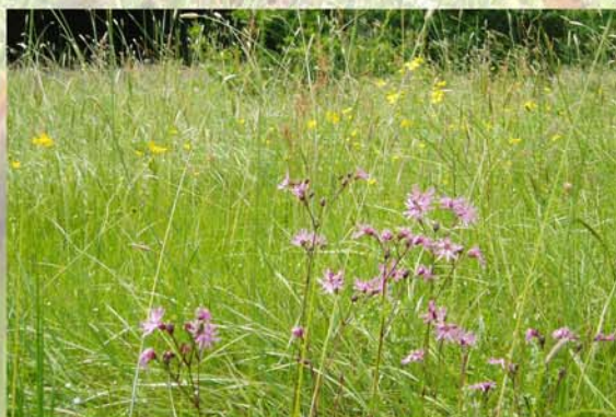
prairie humide "naturelle": lychnis (au premier plan) et renoncule