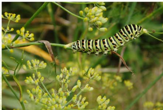
chenille de machaon sur fenouil