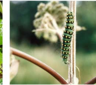
chenille de petit paon de nuit