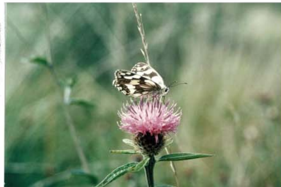
demi - deuil ...

Ainsi, les papillons adultes ont besoin de plantes riches en nectar pour leur alimentation : valériane, succise, centaurée, marguerite, trèfles... Ils déposent leurs oeufs sur des plantes différentes, dont se nourrissent leurs chenilles (fenouil, ortie...)