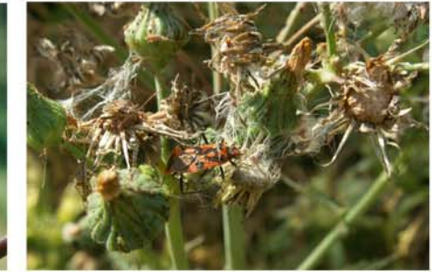
punaise sur Umbellifères

Les plantes à fleurs et les graminées fournissent des graines et des jeunes pousses aux oiseaux.