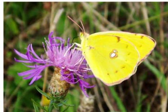
et citron sur centaurée