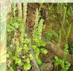
nombri de Vénus