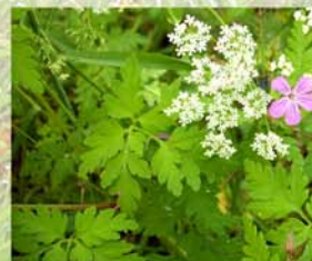
herbe à Robert et conopode dénudé

Elles abritent une faune variée qui y trouve refuge, couvert et site de reproduction. La haie fournit des ressources alimentaires diversifiées (baies, escargots, insectes, micro-mammifères...), permettant de répondre aux attentes spécifiques de nombreuses espèces, notamment d'oiseaux.